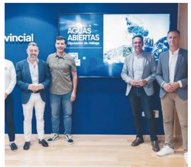
Presentación de la competición.

El calendario comenzará este domingo, 7 de junio, con la III Travesía Ardales-Caminito del Rey. Posteriormente, el 21 de junio se celebrará en Vélez-Málaga la travesía solidaria 'Saca la lengua a la ELA'. Ya en agosto tendrán lugar la XIII Travesía Rincón de la Victoria, prevista para el día 8, y la III Travesía María de Valdés, que cerrará la competición el 29 de agosto en Fuengirola.