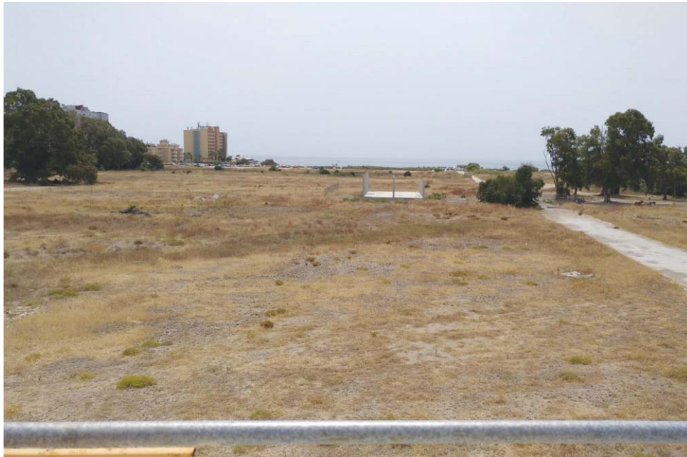
Una visión del espacio del privilegiado Arraijantal desde el interior hacia el exterior. CIRIANA

Costas recuerda que el espacio acumula problemas derivados de vertidos, restos de antiguas infraestructuras, presión urbanística y pérdida