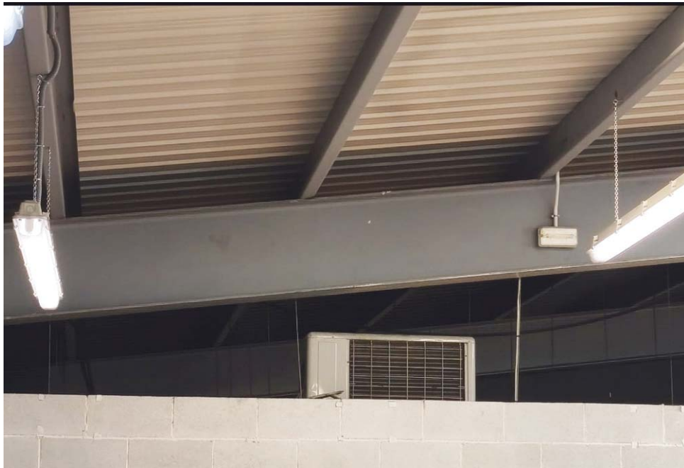
Quejas por el calor en un edificio que consideran que no está bien acondicionado. VM

"Esta circunstancia resulta incompatible con los principios preventivos establecidos en la normativa vigente en materia de prevención de riesgos