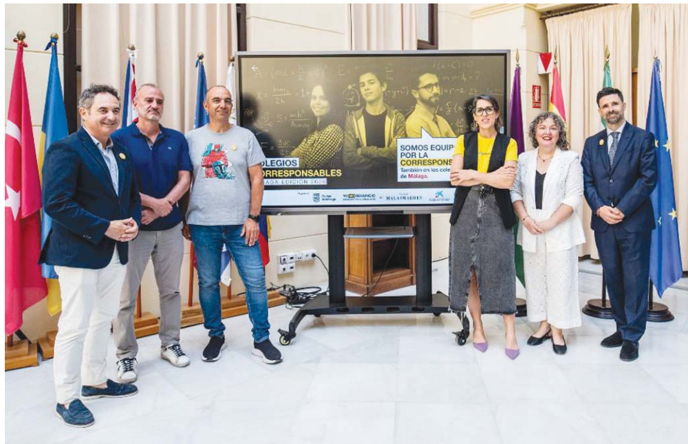
Empezar a ser corresponsables y a cuidar, sin estereotipos de género, empieza en el colegio. AYTO. MÁLAGA

Los testimonios del alumnado reflejan el impacto de la experiencia. Algunos destacan que les ha gustado "aprender de forma divertida". Otros aseguran haberse quedado sorprendidos al descubrir la cantidad de tare-