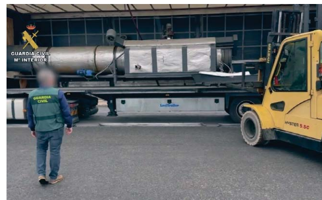
Operación 'Tapol' de la Guardia Civil.

La operación 'Tapol' culminó con la detención de cinco implicados y la investigación de una persona adicional. Durante las actuaciones, se confiscaron distintos tipos de materiales, incluyendo maquinaria industrial para la fabricación de cigarrillos, tres cabezas tractoras y cuatro semirremolques, algunos portando matrículas falsas para el transporte de la mercancía.