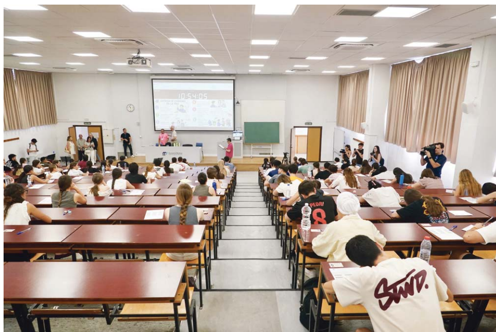
Interior de una de las aulas en la Prueba de Acceso a la Universidad 2026 en Málaga.

La federación asegura que viene alertando de esta problemática desde el pasado mes de abril y señala que algunas familias han presentado reclamaciones ante la Inspección Educativa. Según explica, los casos en los que se