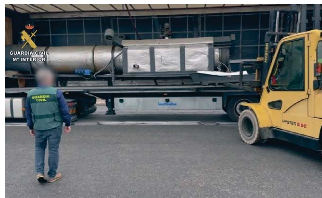
Operación 'Tapol' de la Guardia Civil.

La operación 'Tapol' culminó con la detención de cinco implicados y la investigación de una persona adicional. Durante las actuaciones, se confiscaron distintos tipos de materiales, incluyendo maquinaria industrial para la fabricación de cigarrillos, tres cabezas tractoras y cuatro semirremolques, algunos portando matrículas falsas para el transporte de la mercancía.