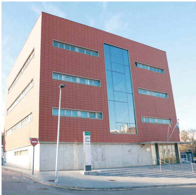
Imagen de la fachada del juzgado de Montoro.

Frente a ello, representantes de familiares de víctimas han realizado alegaciones para impugnar el referido recurso en base a "la inexistencia de causa que legitime a la Abogacía del Estado para personarse como actora civil", por que "nada acredita la Abogacía del Estado sobre presuntos anticipos reconocidos en el Real Decreto Ley, ya que, hasta la fecha, salvo error u omisión de esta parte, las ayudas que