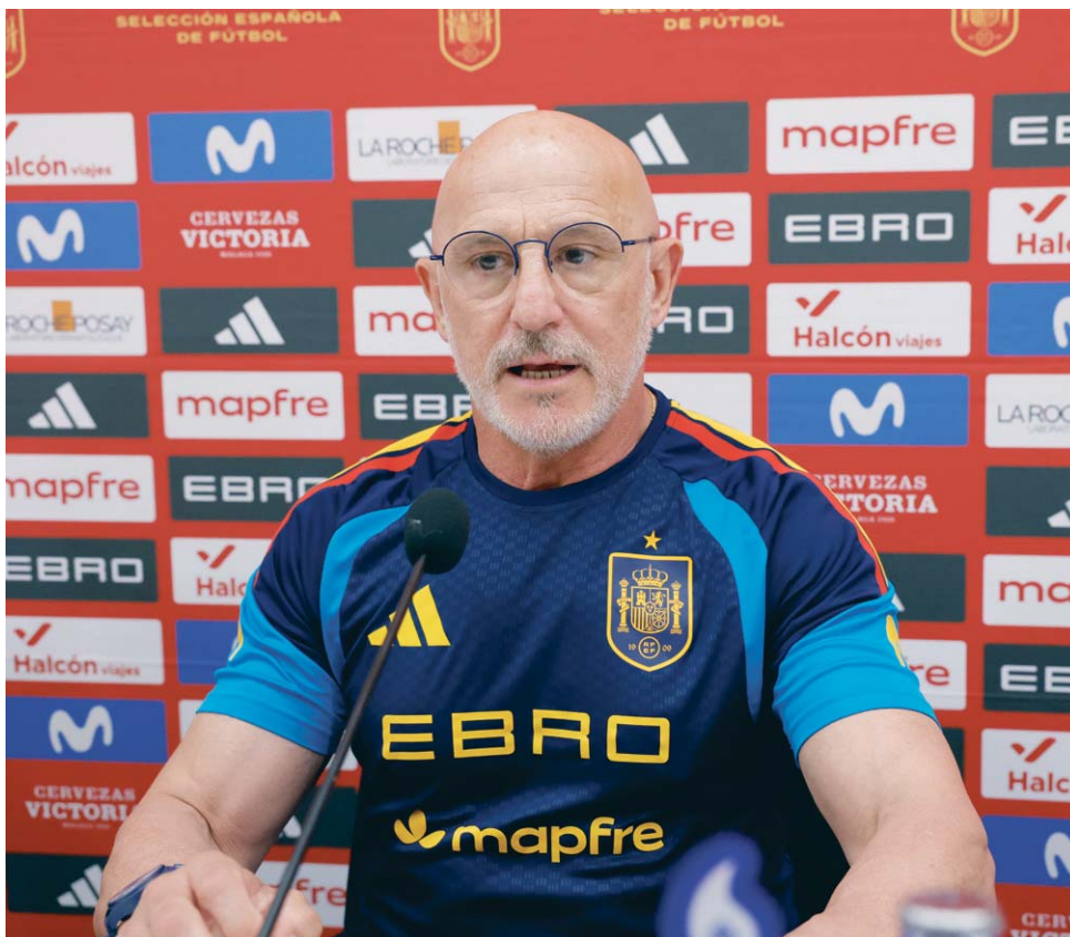
El entrenador de la selección española, Luis de la Fuente, durante la rueda de prensa.

Torneo en el que el capitán será Rodrigo Hernández. “A