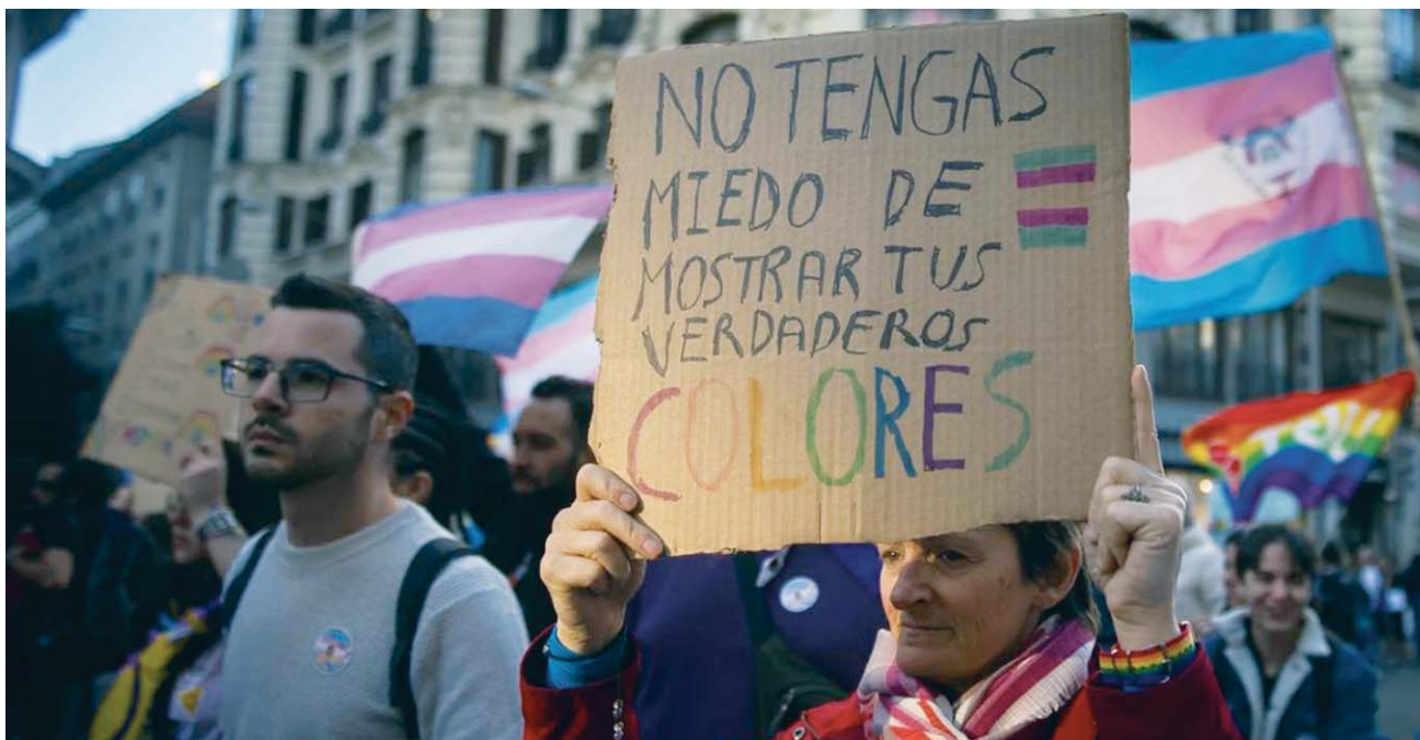
Imagen de archivo de una manifestación para denunciar los ataques a la comunidad trans.

El mayor incremento porcentual se produce en los ámbitos de la islamofobia (+133%), que empezó a desglosarse de forma independiente en 2024; de la disofobia (+90%) y del antisemitismo (+86,5%), si bien las cifras absolutas son reducidas, con 35, 59 y 69 hechos