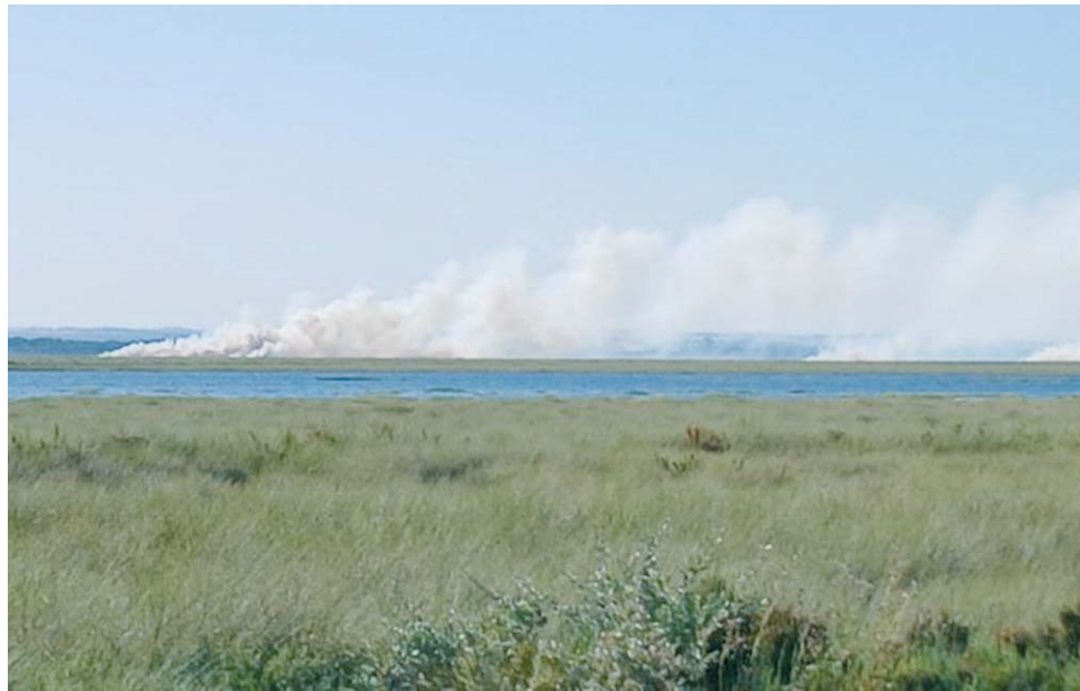
Imagen del incendio en Marismas del Burro este miércoles.

El impacto de la humareda en la salud ciudadana y en el medio ambiente ha activado los avisos de la comunidad científica de la Universidad de