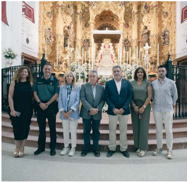
Autoridades visitan a la Virgen del Rocío tras realizar el balance.

La dimensión territorial de la romería también quedó reflejada en los datos. Las hermandades ocuparon 242.257 metros cuadrados, equivalentes