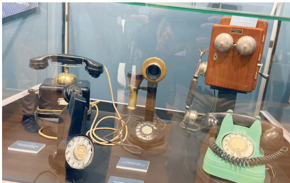
Algunos de los teléfonos antiguos que pueden verse en la exposición.