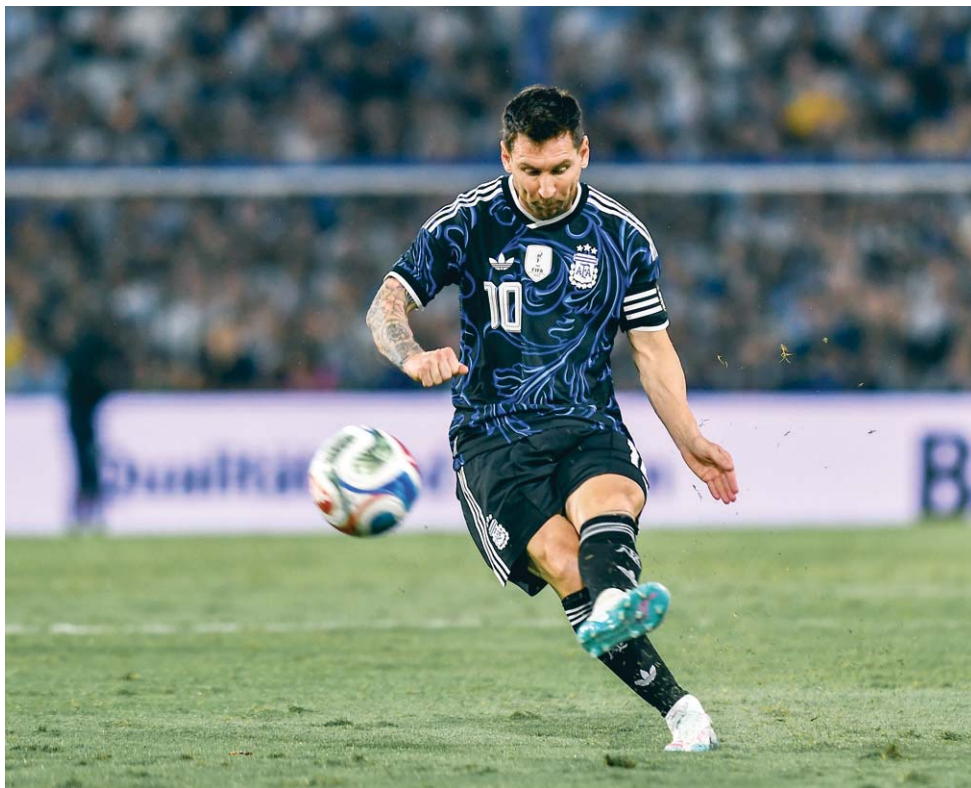
Lionel Messi en acción durante el partido amistoso internacional con su selección.

Tras su etapa en Barcelona, continuó su carrera en el Paris Saint-Germain y, posteriormente, en el Inter Miami CF, club de la Major League Soccer al que actualmente sigue vinculado. Al mismo tiempo, ha sido un referente de la selección argentina, con la que ha alcanzado algunos de los mayores logros del