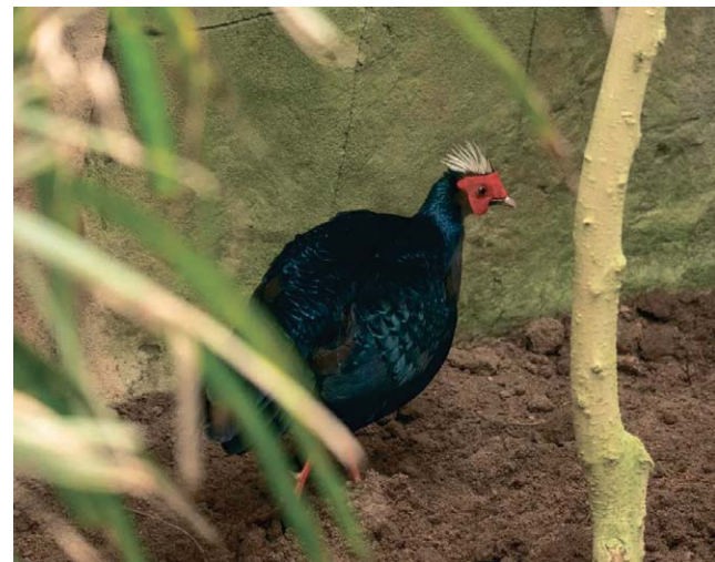
La protagonista de la historia. BIOPARC.

La participación de esta ave supone un momento histórico para BIOPARC Fuengirola y la Fundación BIOPARC. Es la primera especie nacida y criada en sus instalaciones que forma parte activa de un proyecto de reintroducción en el medio natural. El nacimiento de esta faisana se produjo en 2024, cuando el parque logró reproducir con éxito varios ejemplares de faisán de Edwards, convirtiéndose en uno de los pocos centros europeos capaces de hacerlo.