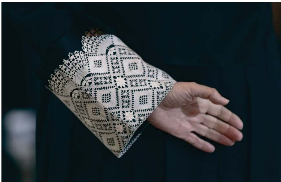
Este jueves arranca la fase de declaraciones en el marco del caso Mascarillas.