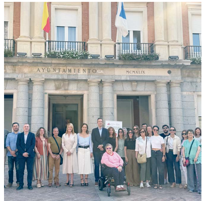
Foto de familia tras la lectura del manifiesto.

MANIFIESTO Concentración en el Consistorio