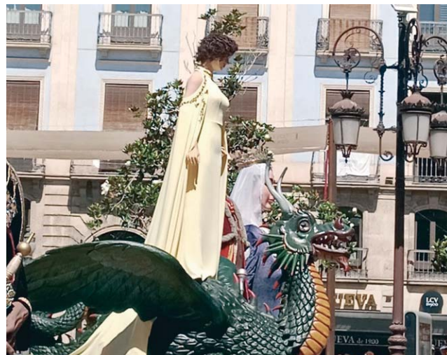
La Tarasca desfila por las calles de Granada.

Rodeada de una gran expectación por parte de grandes y pequeños, la figura de Santa Marta, este año con el pelo corto y rizado, fue precedida de los gigantes y cabezudos, que encarnan a los Reyes Católicos y a los últimos monarcas de la dinastía nazarí