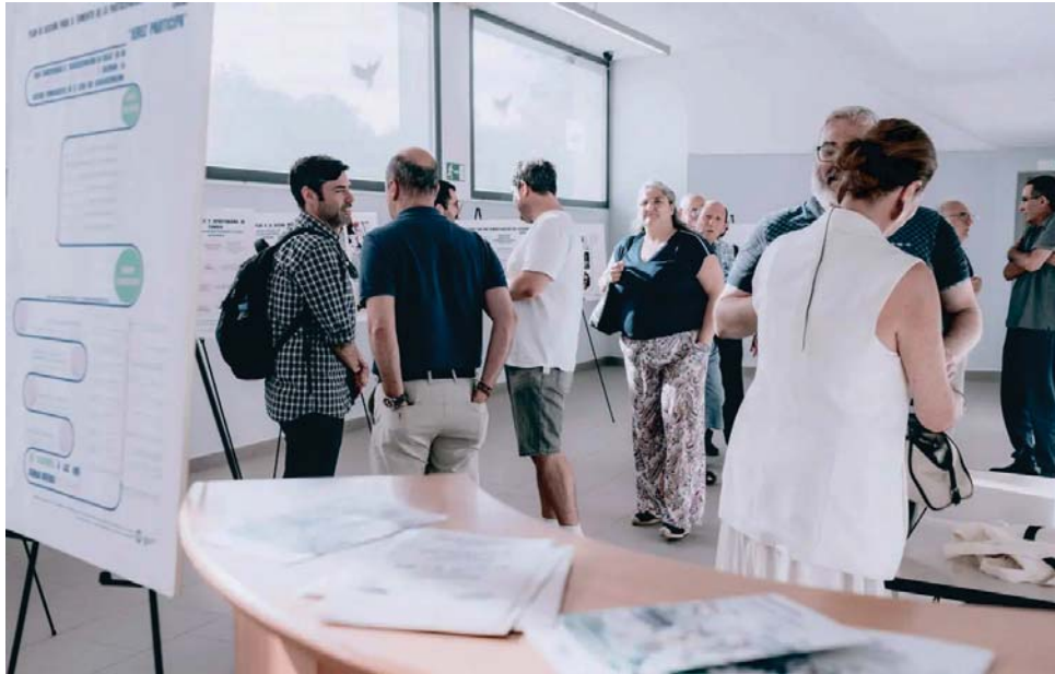
Una imagen del acto de presentación del plan, que se celebró en el centro social Blas Infante. TAMARA PASTORA

El plan propone una veintena de medidas dirigidas a robustecer el entramado asociativo, modernizar los canales de participación y abrir nuevas vías de colaboración entre vecinos y el Ayuntamiento. Además, este documento permanece abierto a sugerencias que se pueden enviar vía web, para enriquecer el contenido antes de su entrega oficial al Ayuntamiento prevista para el otoño. Uno de los temas centrales del encuentro fue la revisión profunda de la actual ordenanza de participación. Se detectó que el marco legal en