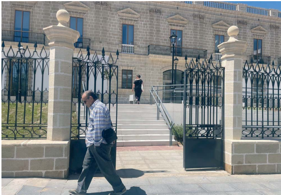
Primer día del nuevo centro de salud Esperanza de la Yedra, uno de los más modernos de Andalucía. VIVA

“¿Ya está abierto? Lo habrán inaugurado esta mañana, no?, preguntaba otra señora a las puertas del centro. A ella no le corresponde, pero sí a su tía, de 91 años. “Fíjate venir hasta aquí desde la calle Arcos”, agregaba. Otra vecina de la calle de al lado celebraba también que por fin estuviera operativo. “Tengo ganas de verlo por dentro, porque es verdad que el de Madre de Dios está muy viejo, y ya hacía mucha falta...pero mira que cuanto menos lo pisemos por muy bonito que sea mejor, ¿no?”.