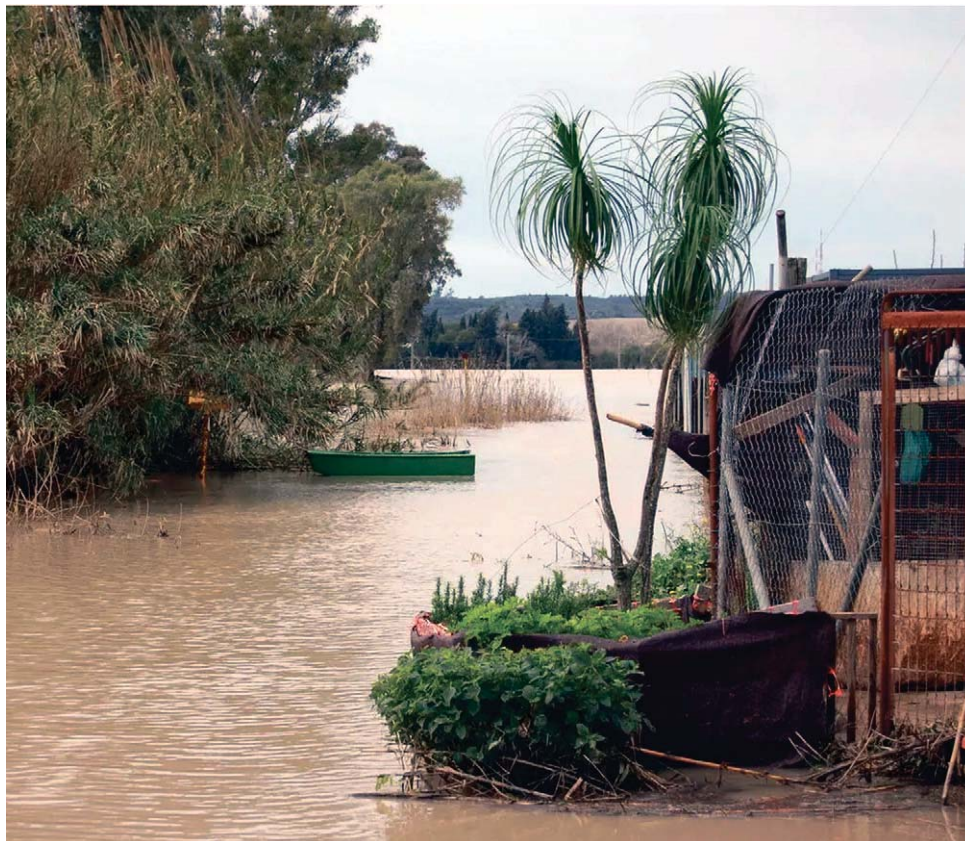
Efectos de la crecida del río Guadalete en el entorno de La Corta, una de las zonas más afectadas. JIMÉNEZ

por el Gobierno central para responder a los daños ocasionados por diversos fenómenos meteorológicos adversos en Andalucía y Extre-