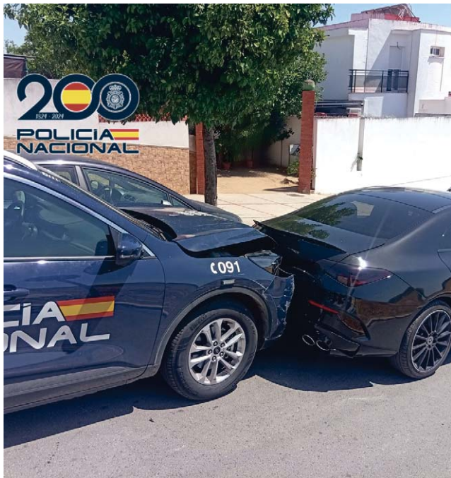
El coche -en el que viajaba un menor- una vez interceptado.

Según explica la Policía Nacional, el conductor desoyó las indicaciones de los agentes para detener el vehículo y emprendió una huida a gran velocidad, circulando de forma extremadamente peligro-