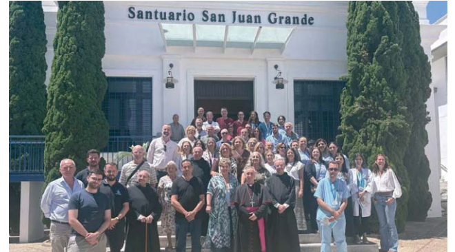
Foto de familia tras la ceremonia en el Santuario de San Juan Grande.